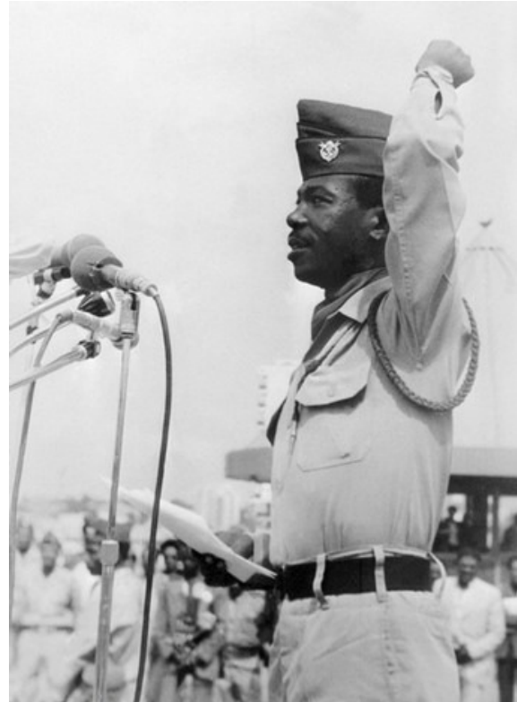
Revolutionens stærke mand Mengistu Haile Mariam, der i 1977 fremstod som militærstyrets ubestridte leder.