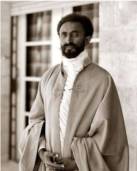
Kejser Haile Sellaisie i hans storhedstid før revolutionen og opløsningen af det etiopiske kejserrige i 1974.

til en radiostation i landet. Men i slutningen af 1960'erne var USA's strategiske interesser i Etiopien imidlertid vigende i takt med, at ny teknologi inden for satellitkommunikation overflødiggjorde radioteknologien. Desuden kom der et fokusskifte i amerikansk sikkerheds- og udenrigspolitik efter Vietnam-krigen. Etiopiens strategiske betydning som allieret på Afrikas Horn, med sin beliggenhed ved indsejlingen til Suezkanalen fortsatte dog, men værdien, som USA tillagde Etiopien som allieret, var aftagende.