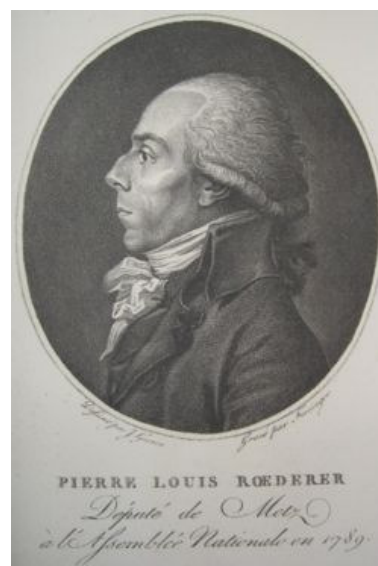
Pierre-Louis Roederer (1754-1835).

Hovedelementerne i dette finder et klassisk udtryk i abbed Sieyès' manifest Hvad er tredjestanden? fra 1789. Endnu klarere forbindes begivenhed og proces i de retrospektive analyser af revolutionen hos to deltagere i begivenhederne, Antoine de Barnave og Pierre-Louis Roederer, der nedfældede deres analyser i henholdsvis 1792 og 1815.