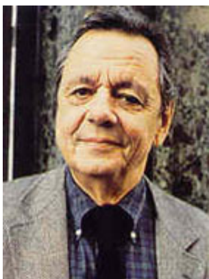
Den franske historiker F. Furet (1927-97), hvis marxismekritik mundede ud i Fukuyama-lignende konklusioner.

I sin kritik af Soboul viser Furet dygtigt, hvorledes nogle af de mest fremherskende marxistiske revolutionshistorikere reelt tolker deres historiske emne gennem en besynderlig blanding af ortodoks marxismeleninisme og en ukritisk overtagelse af elementer af de franske jakobinernes diskurs. Denne tagen revolutionens talsmænd for pålydende og denne supplering med en bestemt model for Verdenshistorien ligger ifølge Furet til grund for Sobouls opfattelse af den franske revolution som 'borgerlig'.