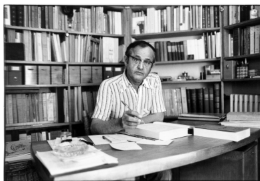
Den franske historiker Albert Soboul (1914-82), der fremstillede sans-culottes kampen mod borgerkabet som et led i borgerkabets revolution.

For at komme lidt nærmere denne mentalitet kan et være værd at se på et delvis tilsvarende argument, der ganske vist omhandler et mere afgrænset felt end Historien, men hvis implikationer bestemt ikke er mindre vidtrækkende. I den i mange henseender epokegørende bog Penser la Révolution française fra 1978 kan den franske historiker François Furet siges at foregribe Fukuyamas påstand om en lukning af historien. Han erklærer her den politiske, sociale og diskursive cyklus, som åbnedes gennem den franske revolution, for afsluttet: Den liberalistiske ideologis understregning af individrettigheder er blevet forenet med den konservative understregning af behovet for en stærk social orden og en stærk stat til at sikre den sociale kohæsi. Dermed er en dyb revne, som har præget det franske samfund i det meste af to århundreder, blevet lukket (Furet, 1989). Sammenvævet med Furets beskæftigelse med den franske revolution er dennes associering med den eneste anden moderne politiske udvikling, der hævdes at påkalde sig tilsvarende verdenshistorisk betydning, nemlig den russiske revolution. Hans umiddelbare projekt er et opgør med marxistiske – eller rettere: partikommunistisk ortodokse – tendenser i forståelsen af den franske revolution, herunder forståelsen af 1789-revolutionen som den ufuldendte foregribelse af 1917-revolutionen.