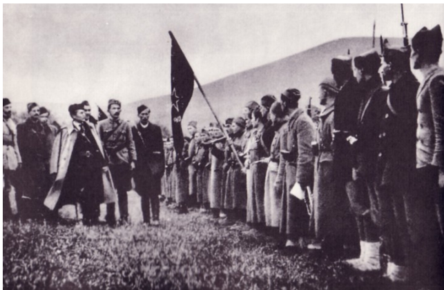
Tito og partisanernes øverste ledelse inspicerer Første Proletarbrigade i Bosnien 1942. Proletarbrigaderne var partisanernes elitetropper og promoverede åbenlyst det revolutionære projekt

I efteråret 1943 kapitulerede det Fascistiske Italien og overlod store områder og våbenressourcer i hænderne på partisanerne. Krigslykken var på partisanernes side, og i oktober 1944 kunne partisanhæren med hjælp fra den Røde Hær indtage Beograd. Den Røde Hær overlod til de jugoslaviske partisaner at nedkæmpe de tilbageværende modstandere og erobre resten af Jugoslavien. I løbet af denne proces sikrede kommunisterne sig en absolut magtposition, baseret på den enorme partisanhær. Ved krigens afslutning kunne kommunistpartiet i kraft af den totale kontrol over partisanbevægelsen diktere efterkrigstidens politiske system.