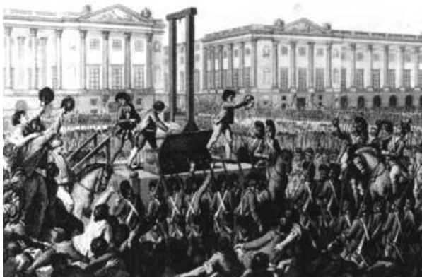
Henrettelsen af kong Ludvig den Sekstende

”Fransk frihed”, er for Burke ”intet andet end frie tøjler til syndighed og forvirring” (1791c: 633). Heroverfor står den ægte frihed, der er en ”mandlig, moralsk, reguleret frihed” (1790: 89), altså en selvbegrænsende frihed af aristokratisk-dannet karakter. Burke kan ikke forstå udstrækningen af frihed til flere grupper og flere områder som andet end tøjlesløshed. Fransk frihed er en imperialistisk frihed, der vil underlægge sig alt og alle, og som ikke anerkender nogen begrænsninger. Det er en ”ensom, uforbundet, individuel og selvisk frihed” (1789: 505), der kun har sine egne interesser for øje. Derfor siger Burke, at ”begæret efter og skabelsen af en tyrannisk dominans lurer i kravet om en ekstravagant frihed” (1791c: 642).