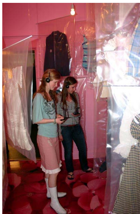
Publikum føres rundt i udstillingen af digitalguiden, der præsenterer pigernes og drengens historier gennem tematiske fortællinger, fotos og filmklip.

Når publikum, børn som voksne, har været rundt i udstillingen, har de også mulighed for at høre alle historierne og finde genstandsoplysninger på computere i Kvindemuseets Museotek. Det er et udstillingselement, der blev videreudviklet efter brugertest allerede i efteråret 2005. Vi erfarede her, at de større børn ville høre netop den person fortælle, hvis barndomshistorie de var på sporet af. Og de ville vide mere om de ting, de fandt i udstillingen.