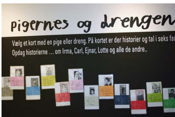
Væg i udstillingen med 28 identitetskort.

De styrende principper for udstillingens opbygning er altså en udstilling med historier, der kan opleves med hele kroppen. Og det kropslige element overføres også til det andet spor i udstillingen, den kulturhistoriske skattejagt, hvor nutidens børn kan følge et eller flere af de 28 autentiske børn, 14 drenge og 14 piger, der var børn i perioden fra 1860'erne og frem til 1980'erne.