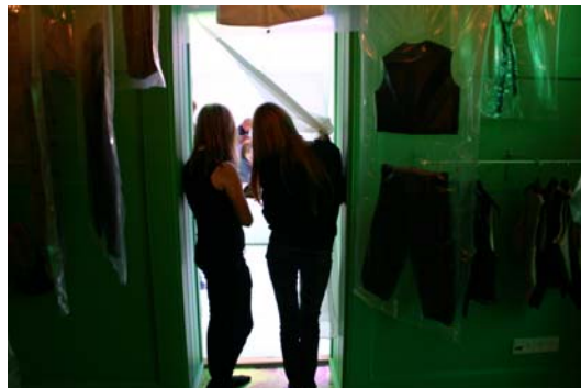
To piger kigger ind i lysrummet, hvor drengene tumler.

forholdet mellem kønnene, går tendensen i tiden nok snarere mod, at kønnene indtager hinandens arenaer – og mod flere ligheder. F.eks. spiller stadig flere piger fodbold, og drenge går mere op i deres udseende.