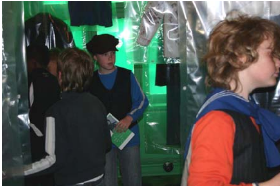
Drenge klæder sig ud i det grønne garderobrum. Foto: Carina Serritzlew, 2006.

det, tussmørke med fortællinger bag det store nøglehul om noget frækt og pinligt samt et grønt og pink garderobrum for drenge og piger med tøj fra gamle dage, som man kan prøve.