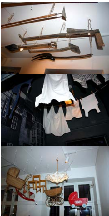
Svævende udstillingsgenstande.

rintiske forløb på og under montrer overrasker! Ja, I må godt gå på monterne! I monterne står genstande og tal, der knytter de konkrete genstande til et bestemt barn. Andre genstande står frit ... til at røre eller prøve: dyr, seng, skolepult, trillebør og tøj fra gamle dage. Andre igen svæver under loftet, alt fra markredskaber og legetøj til vasketøj, pigetøj og drengetøj, der hænger i vacuumpakket opbevaringsplast, selvfølgelig efter musealt forsvarlige opbevaringsprincipper.