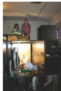
6. classes elever fra Århus på skattejagt over og under udstillingsmontrer.