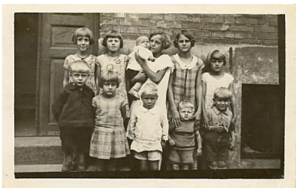
Gadens piger og drenge. Århus i 1930'erne.

Museets ambition er at skabe et sted, hvor børn har mulighed for at forstå deres forventninger og adfærd over for hinanden og styrke deres opfattelse af sig selv som noget, der har med køn at gøre. Køn er således både kulturarv – barndommens foranderlighed, men også genkendelighed historisk set – og en del af det