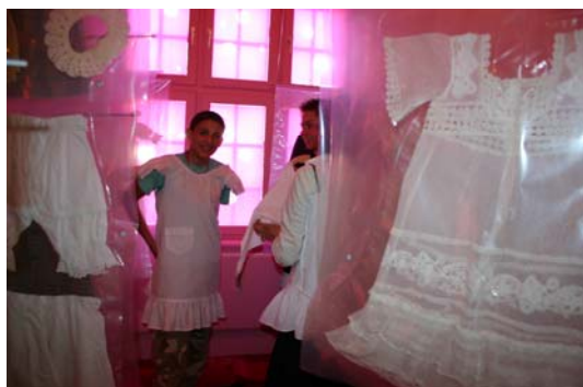
Drengene prøver pigetøj- og grænser? 6. classes elever fra Århus. Foto: Carina Serritzlew, 2006.

Når man siger formidling, har man også sagt målgrupper men ofte med ensidigt fokus på alder, social status o.a.. Men spiller kønnet ikke en rolle for børns brug af og oplevelse af denne udstilling og museers udstillinger generelt? Udstillingen Pigernes og drengenes historier er den første, der formidler børns kulturhistorie med fokus på køn. Vi vil netop fastholde dette fokus på køn ved nu også at undersøge forskelle og ligheder i pigers og drenges tilgang til udstillingen.