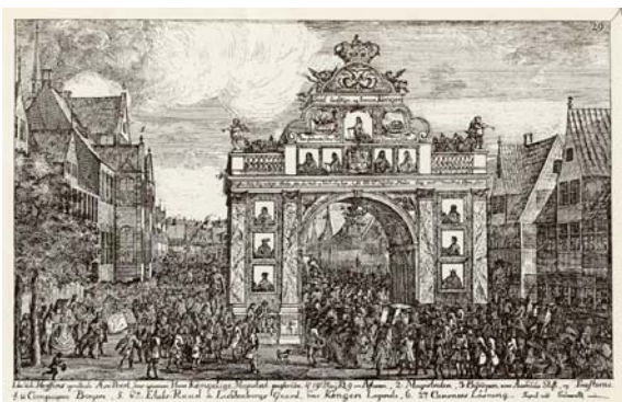
I 1749 tiltrak kongens besøg store memeskemængder i Horsens. På denne æresport ses det oldenborgske dynasti og en engel, der svæver i buen. Således sammenknyttes kongemagten og Guds velsignelse i antikens formsprog.

Kongens tilknytning til himlen understreges endvidere af en engel, der svæver i selve buen, og der er skrevet fromme ønsker om "Gud ledsage og bevare kongen". 5 Således forbindes kongemagten med Gud og bliver dermed guddommeligt legitimeret. De vigtigste elementer i befolkningens opfattelse bliver derfor, at dynastiet og især den regerende konge forener territoriet med bifald fra Gud. Henvisningen til dynastiet kan i Max Webers terminologi betegnes som vægtning af "traditionen", og kongemagten får dermed en dobbelt legitimitet, idet både dynastiet og religionen vægtes.