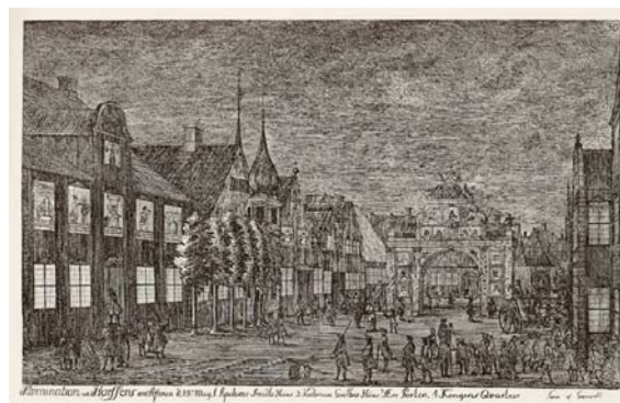
Et festligt oplyst Horsens ved nattetide i 1749. Bemærk illuminationerne på husrækken til venstre.