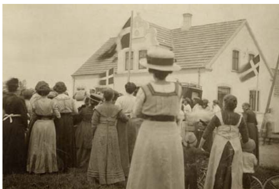
Dengang som nu tiltrak kongehuset sig megen kvindelig interesse. Christian X anes i baggrunden ved flaget længst til venstre under et besøg i Ikast 1913.

Æresporte dukkede stadig til tider op, mens illuminati- onerne var forsvundet.